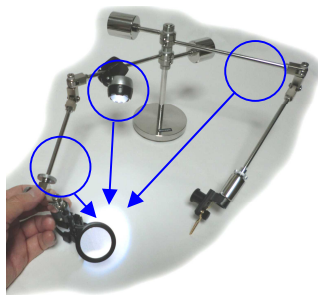
①アームへの取付箇所例