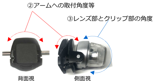
②アームへの取付角度等